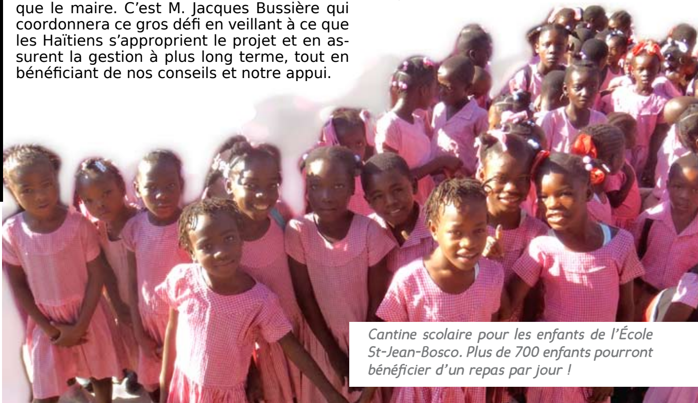
Cantine scolaire pour les enfants de l'École St-Jean-Bosco. Plus de 700 enfants pourront bénéficier d'un repas par jour !